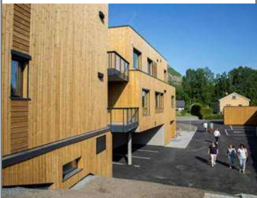
Brynsveien 153 - Bærum kommune