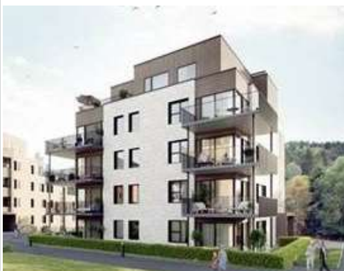
Kvernstua – Nittedal kommune