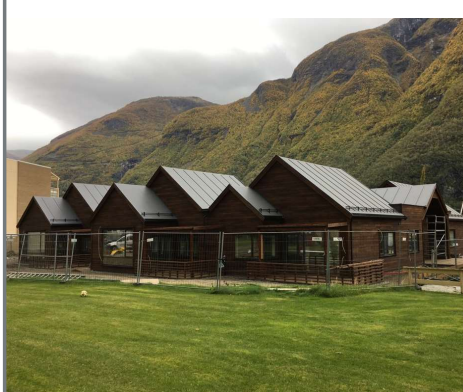
Klyngetunet - Årdal kommune