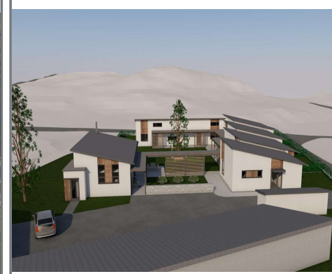
Vollekjær – Grimstad kommune