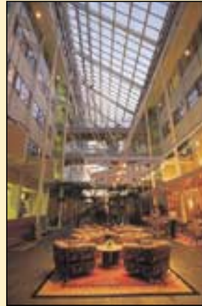
Quality Hotel Edvard Grieg