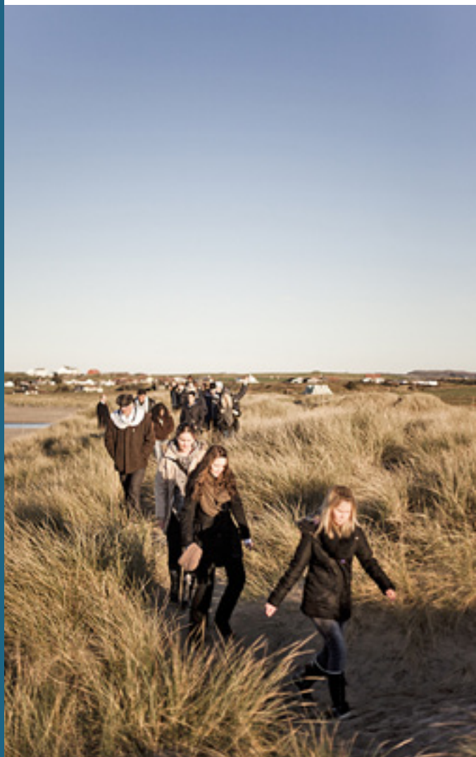
Elevene ved folkehøgskolen på tur i det vakre jærlandskapet.

kanskje er mer hensiktsmessig å ha rom alene likevel. Jenter og gutter bor ikke på samme rom, men deler samme gang og fellesrom.