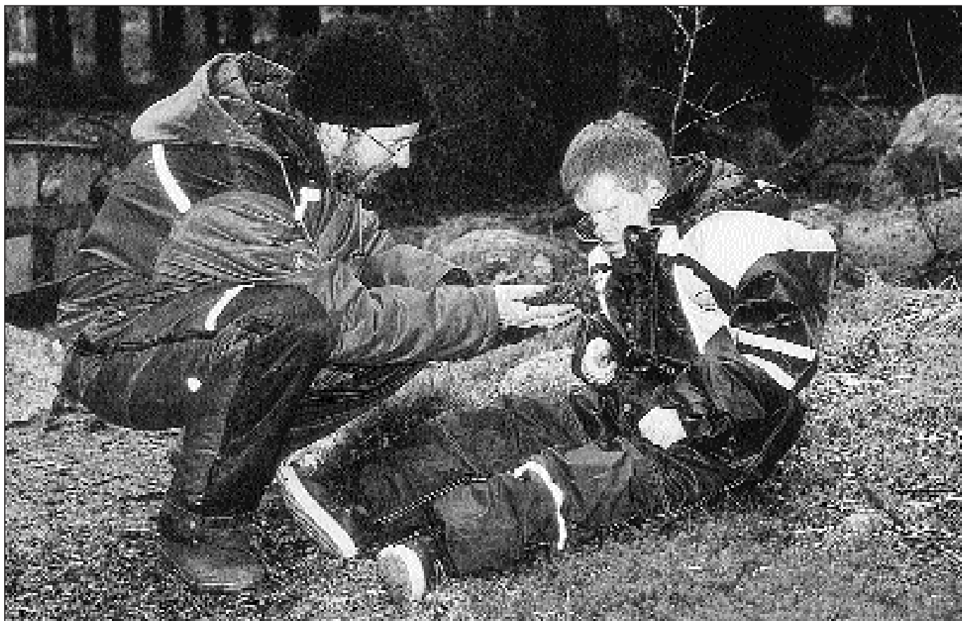
Emnearbeid: Utsmykking av svalgangen, med tema «Lukt». (Foto: Oddveig Hebnes).

hjem og læring, som ellers i samfunnet er splitta, sammen til et hele, i ET HELHETLIG MILJØ.