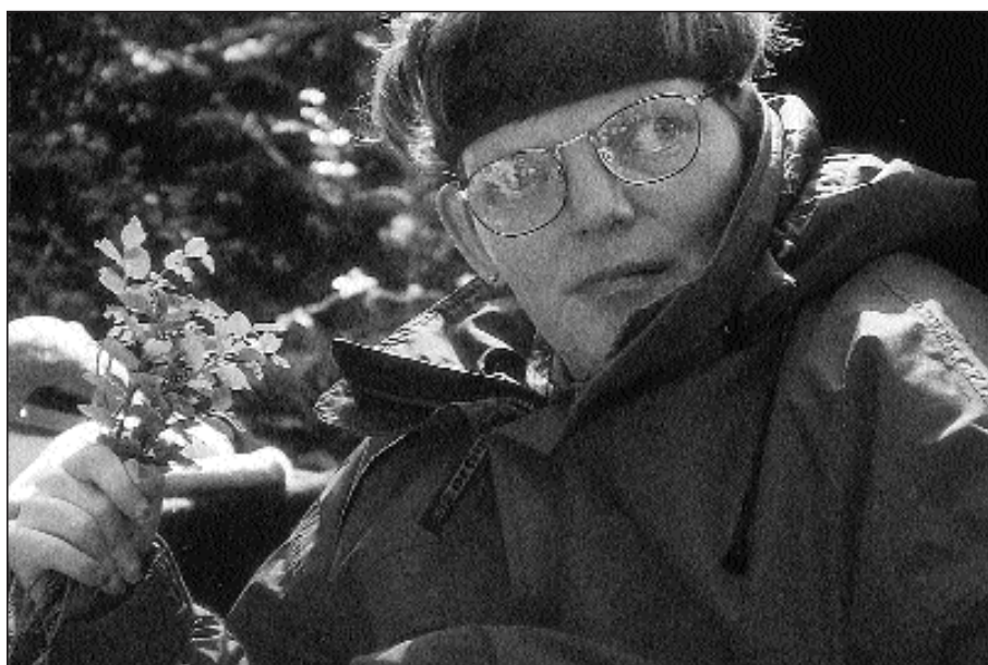
Bruk av naturen og sansehagen i læringen. (Foto: Oddveig Hebnes).

„ Men vi har sett eksempler her i kommunen på at hagearkitekter planlegger «sansehage» på bestilling, og så blir det bare «fint», og ikke til å bruke for dem det skulle være for.