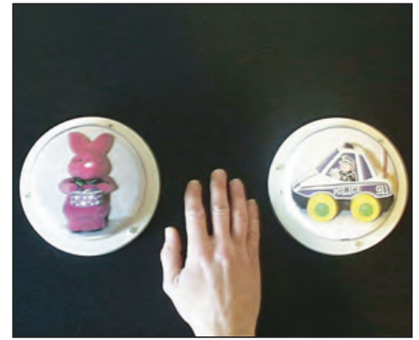
Valg mellom ulike lekeaktiviteter som er representert ved bilder på talemaskiner med innleste beskjeder, kan foretas ved å trykke på symbolet for den foretrukne leken.

sjoner, vil bidra til en slik utvikling. Når den funksjonshemmedes handling blir bekræftet og tillagt en bestemt betydning, kan dette medvirke til å befeste handlingen som et spesifikt kommunikativt utsagn med et klart definert innhold.