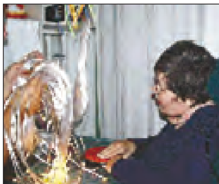
Et individuelt utformet miljø som inspirerer til oppmerksomhet, mestring og deltagelse, gir felles opplevelser og er et godt utgangspunkt for samhandling og kommunikasjon.