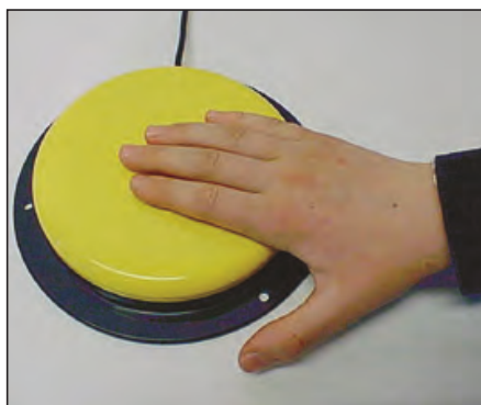
– Det sosiale og fysiske miljøet gir muligheter for mestring.