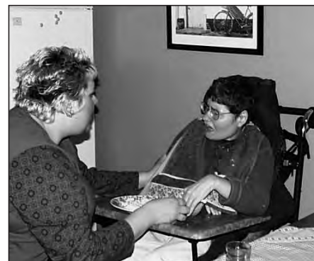
Nærpersoner som er oppmerksomme og tydelige i samhandlingen kan tilby mennesker med alvorlig og dyp psykisk utviklingshemming gode muligheter for kommunikasjon.

grad av våkenhet og oppmerksomhet være utgangspunkt for forståelse av personen. Når mennesker i miljøet til den funksjonshemmede blir kjent med og lærer å identi-