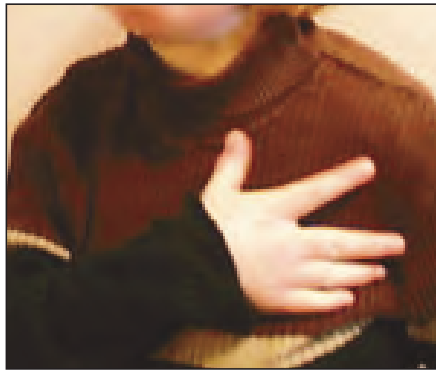
Et ønske eller behov kan uttrykkes med et personlig håndtegn som gis et spesifikt innhold.