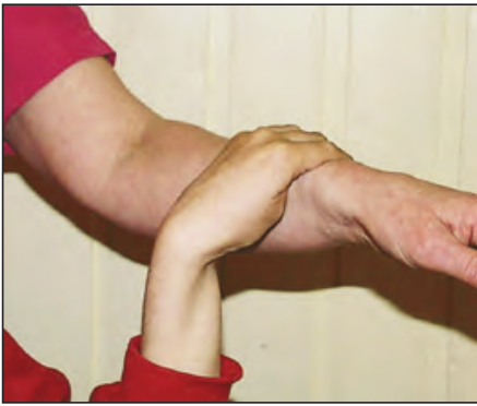
Et ønske om å få tilgang til en attraktiv gode eller hendelse kan uttrykkes ved å rette en handling mot en annen person.