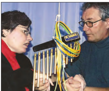
– Det sosiale og fysiske miljøet muliggjør kommunikasjon.

» Erfaringer viser at det er lettere å få igang samspill når det svares entusiastisk.