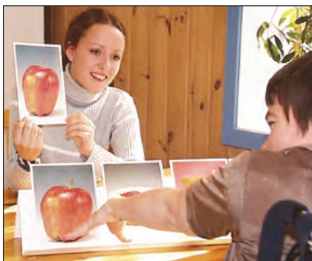
I dette spillet må spillerene sammenligne og gjenkjenne bildene på spillkortene. Spilleren som har det identiske kortet og sier ifra vinner et par.