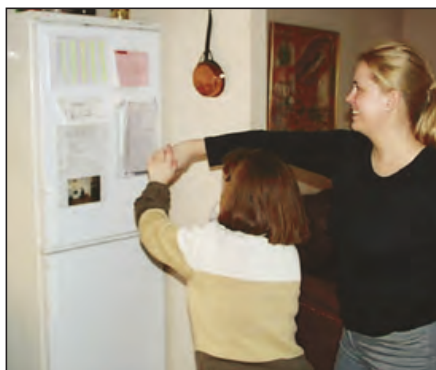
Et ønske kan antydes ved å lede en person til et objekt eller en arena for en hendelse og tydelig indikere hva det bes om hjelp til. Her bes det om å få drikke som står på kjøleskapet.

„ Det er av stor betydning at de behersker alternative uttrykksformer alle kan forstå.