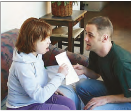
Uttrykksformer som benyttes bør ha en tydelig utførelse og et presist innhold, slik at budskapet er lett å forstå.

nedfelles i langsiktige habiliteringsplaner og mer kortsiktige individuelle deltagesplaner. Slike individuelle planer kan være rettleidende for samhandlingen i dagliglivet og når fagteamet planlegger opplæring og utarbeider nye tilbud.