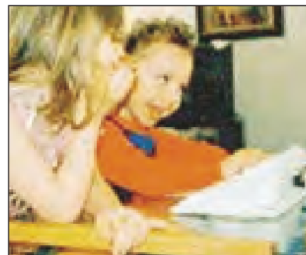
Det er av avgjørende betydning at barna selv blir deltagende. De må få erfaringer med å være i dialog med andre og i å kunne påvirke omgivelsene.