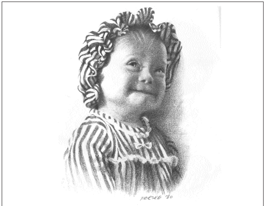
Tegning reproduisert med tillatelse av Martha Perske fra PERSKE: PENCIL PORTRAITS 1971–1990 (Nashville: Abingdon Press, 1998).

I felt nr 3 kan man tenke seg at en person i likhet med felt nr 1 er i en situasjon med underskuddsbehov, og hvor dette er blitt til et offentlig anliggende. Omsorgsovertakelse kan være et slikt eksempel. Her er det