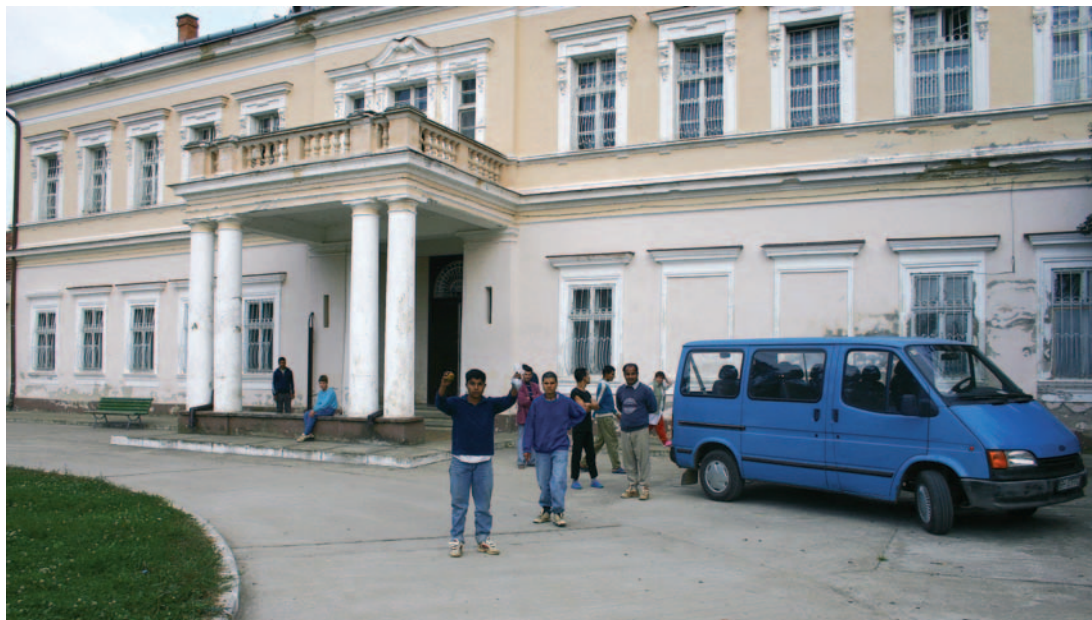
Institusjonen i Cadea.

oppbygging av et differensiert omsorgssystem. Romania har vanskelig økonomi, og det er ikke realistisk at institusjonene vil bli erstattet med små hus i overskuelig framtid. Det viktigste blir derfor å gi folk tilbud om aktivitet, omsorg og nærhet på de institusjonene en har.