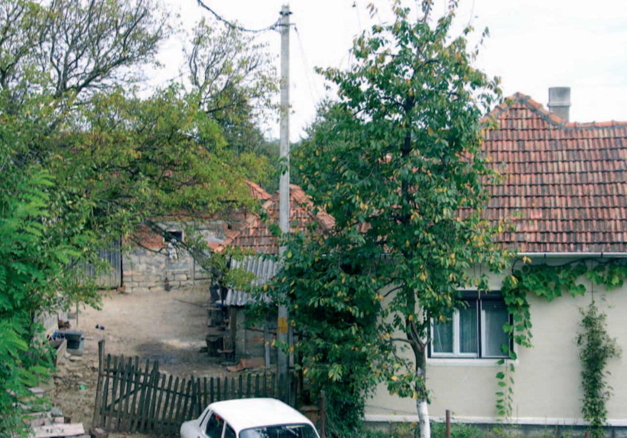
En av gårdene der unge voksne bodde i familieenheter.

poteter i år. I tillegg til arbeidet de utfører på egen gård, ber bøndene i området dem ofte om hjelp til dette eller hint. Det gir ekstraintekter. På samme måte som når de selger varene sine på markedet, og får litt ekstra for det. En forteller at han har planer om å gifte seg, og alle snakker i munnen på hverandre om alt som skal til av forberedelser. Det er tydelig at de er opptatt av å hjelpe hverandre.