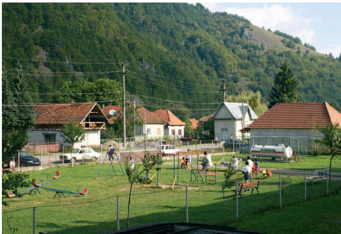
Lekeområdet utenfor barnehjemmet i Remeti.