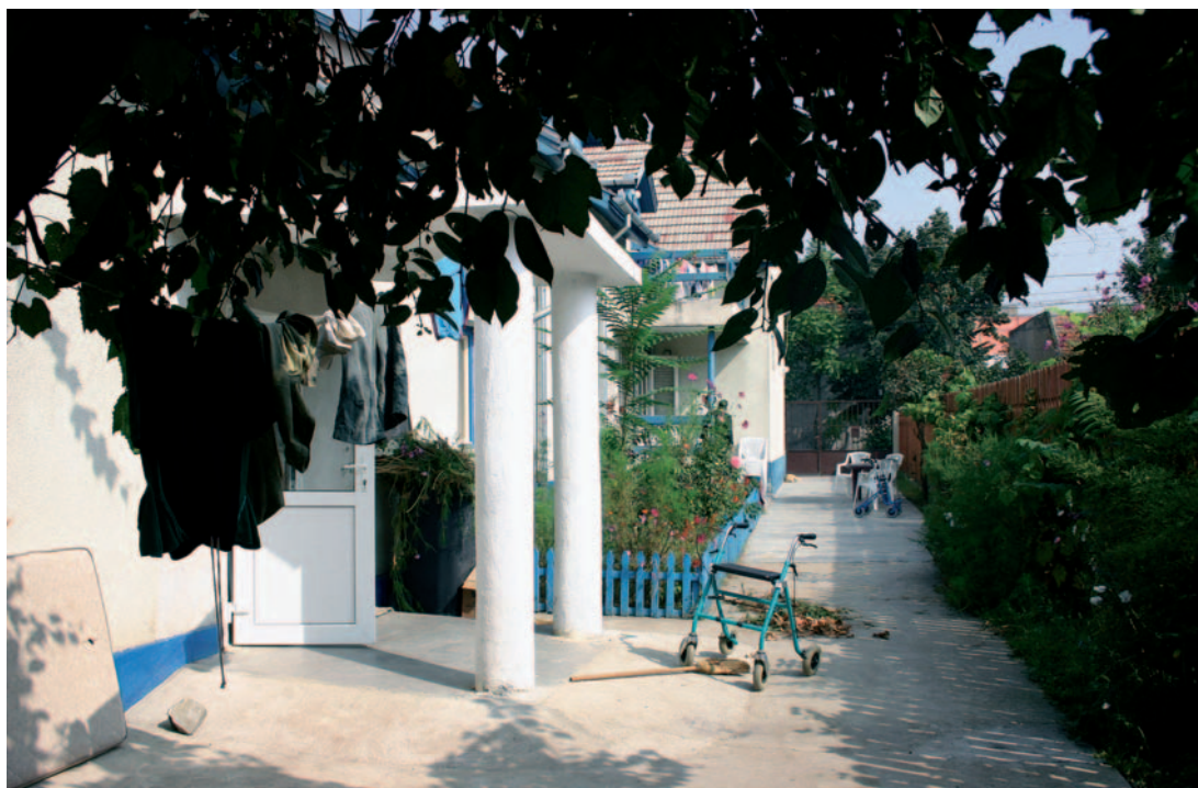
Bofellesskap i Oradia.

Samtidig er det noen unge voksne som benytter anledningen til å fortelle oss at dette ikke er et bra sted å bo. En sier: «Det er ikke en skole, og ikke et verksted. Dette er et sykehus». Vi ser mannsfløyen, hvor det er sovesaler med opptil åtte senger: Sykehussenger, som gjør plassen på gulvet minimal. Noen steder har de hvert sitt skap, noen steder deler de skap med sidemannen. Men mennene har både arbeidstøy og fritidssklær. Alle spiser måltidene i beboerkantinen samtidig, på sine egne faste plasser. I naborommet er det personalkantine. Denne institusjonen er en del av det nye støttesystemet for voksne. Og beboerne kan i prinsippet bli her livet ut dersom de ikke får «noe bedre» å gå til. Både Dr. Andro og direktøren her i Cadea forteller om et vanskelig system, og et stivbent byråkrati. Samtidig ivrer begge etter å skape gode levevilkår for sine beboere innenfor de eksisterende rammene.