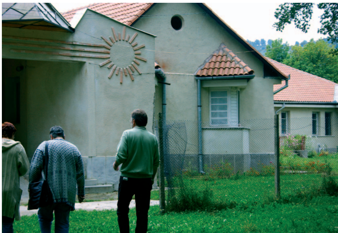
Institusjonen i Bratca som sorterte under sosialmyndighetene.

Vi, som har tråkket våre «barnesko» på sentralinstitusjonen Vestlandsheimen, kjenner igjen mye i det nye systemet, som har relativt bra bemanning og rimelig god økonomi. Det nye tilbudet erstatter et langt dårligere tilbud, men det er fortsatt langt igjen til det materielle nivå vi kjenner fra norske bofellesskap for utviklingshemmede. Den informasjonen vi får tyder på