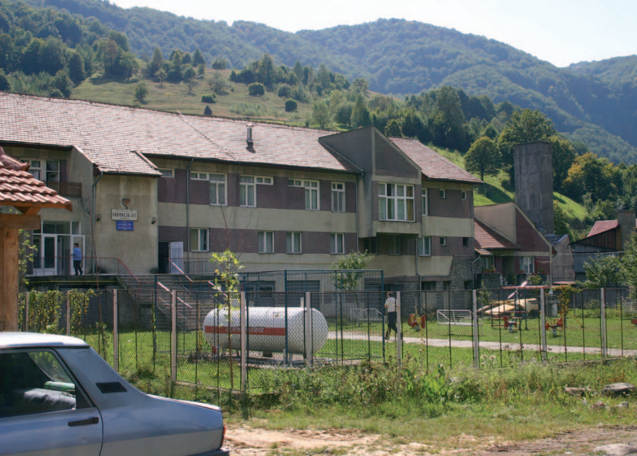
Barnehjemmet i Remeti.

renovering, nye møbler og mye annet som var nødvendig. I årene fram til i dag er huset pusset opp, renoveret og utstyrt til dagens nivå. Barnehjemmet fremstår i dag som rent, ryddig og stort sett i bra stand.