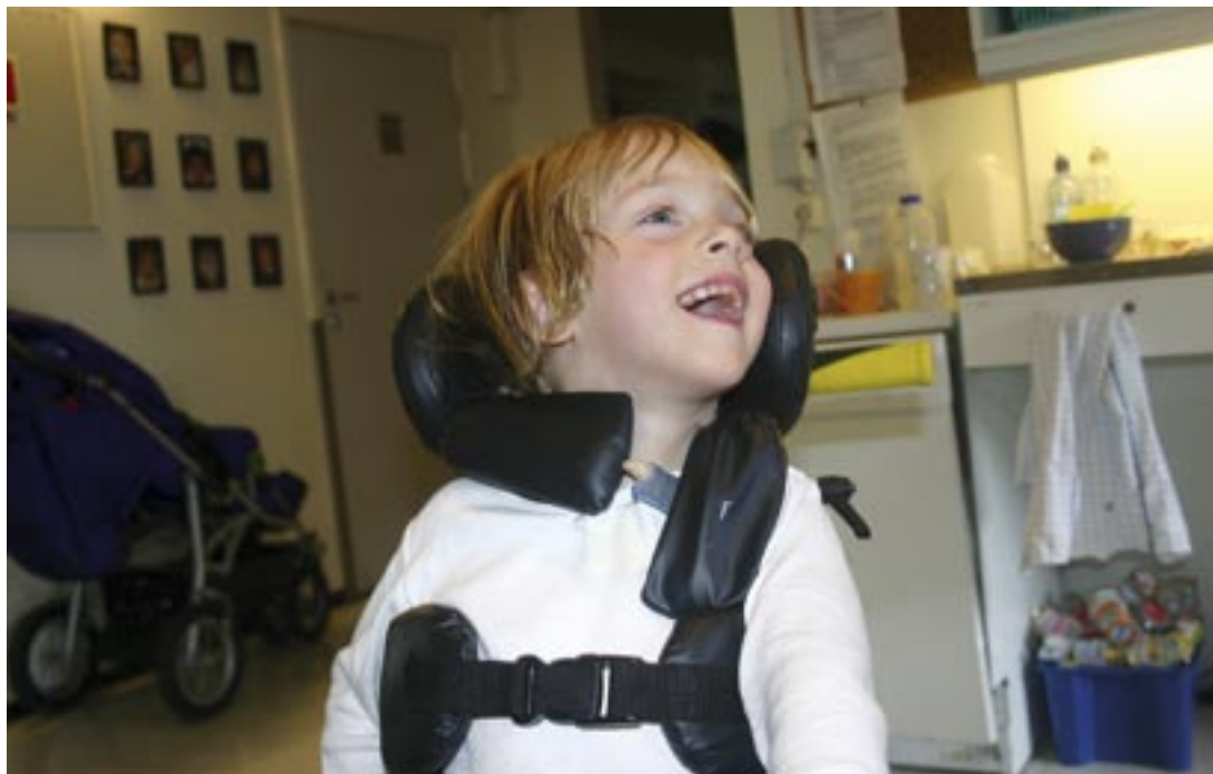
Aurora trives i barnehagen.