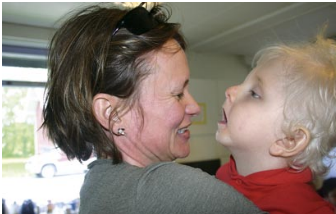
Endelig kommer mamma!

prøve seg og Herman ser ut til å trives. Han viser stor interesse for å peke på de ulike bildene på skjermen. Her er blant annet bilder av Thomas-toget, av bror, mor og familiens hus. Ved å være borti bildene på skjermen får han fram små vide-osnutter. Fra tidligere å bare veive med armene peker han nå målrettet på skjermen.