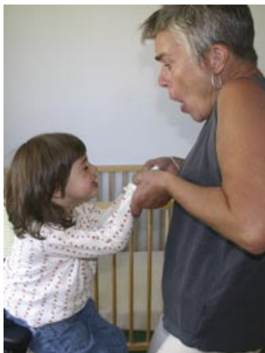
Opp, opp, opp, det er et strev!