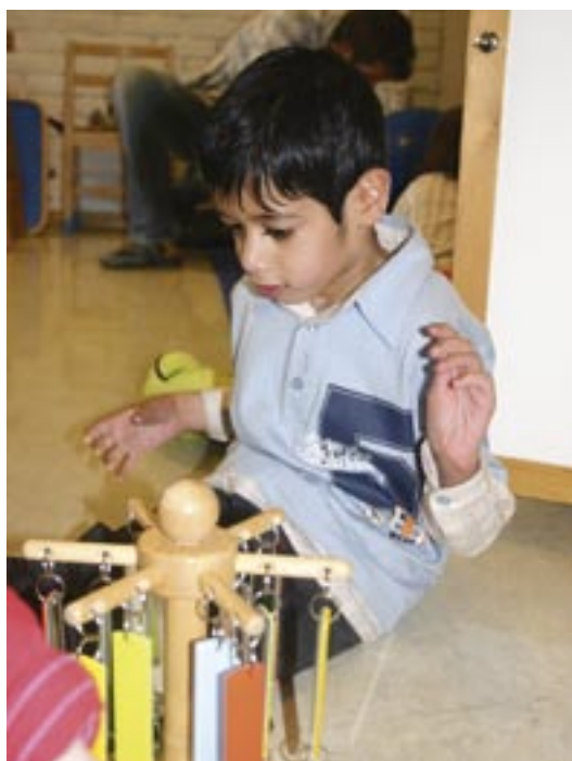
Afaq liker leker som lager lyd og bevegelse.